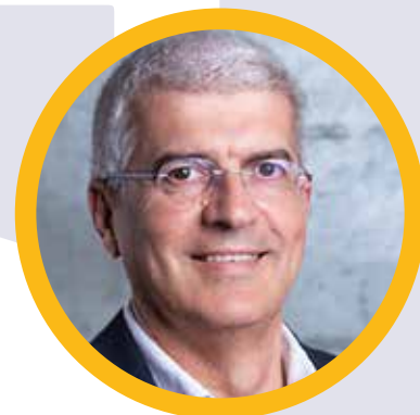
ANTÓNIO GRILO Agência Nacional de Inovação