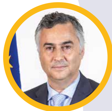
FERNANDO ALEXANDRE Ministro da Educação, Ciência e Inovação