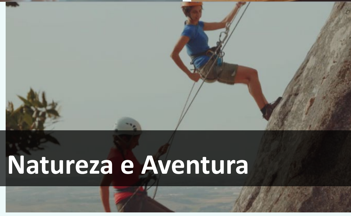
Natureza e Aventura