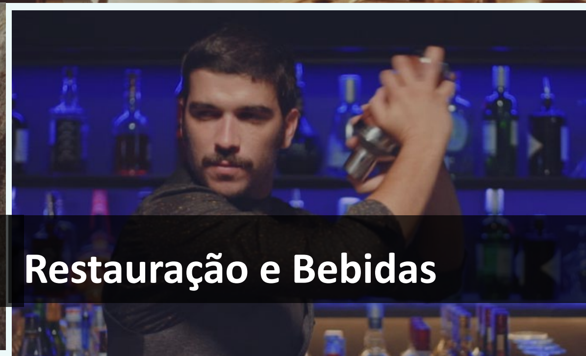
Restauração e Bebidas