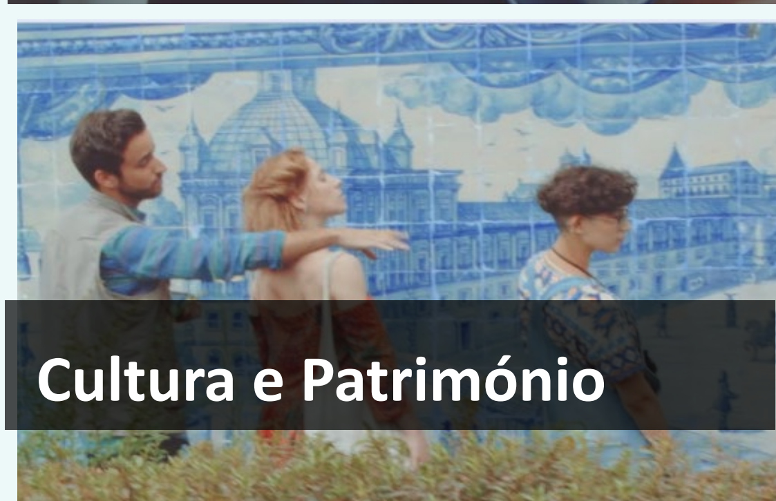
Cultura e Património