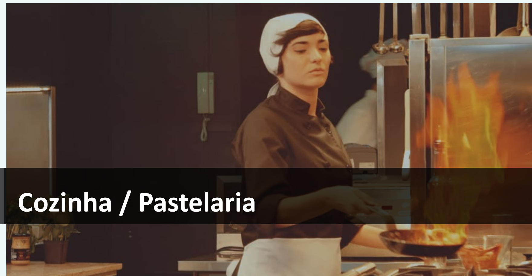
Cozinha / Pastelaria